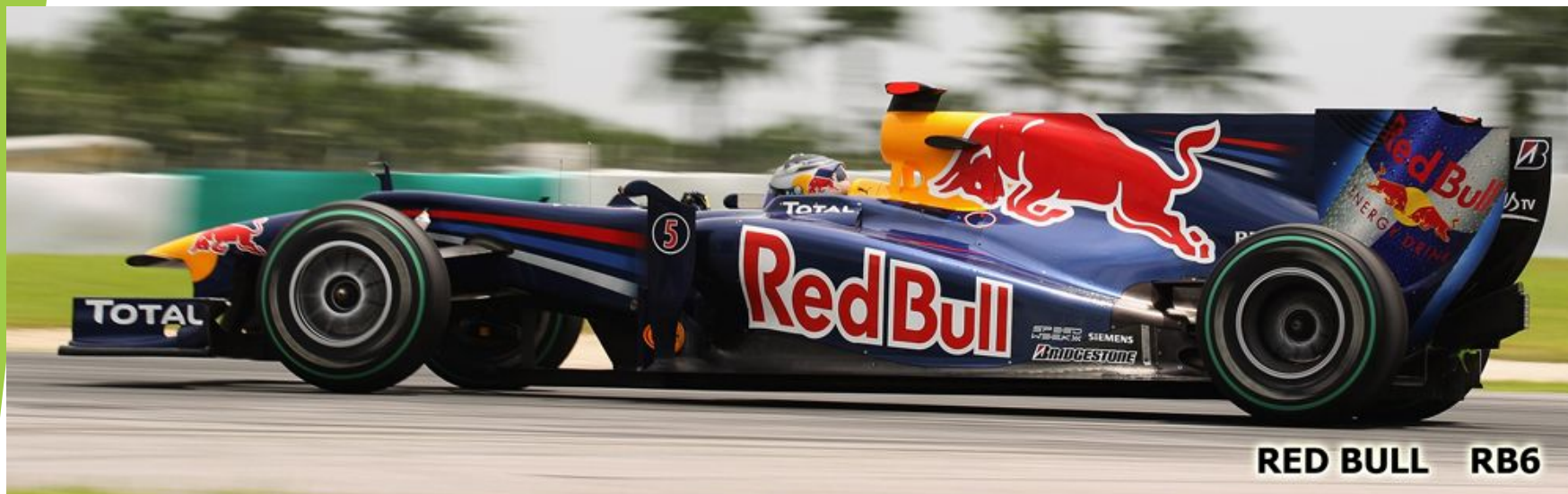
RED BULL RB6