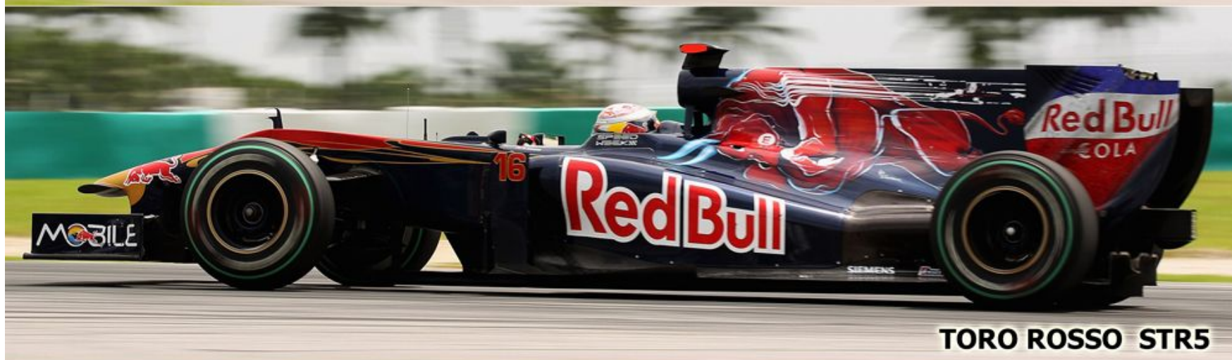
TORO ROSSO STR5