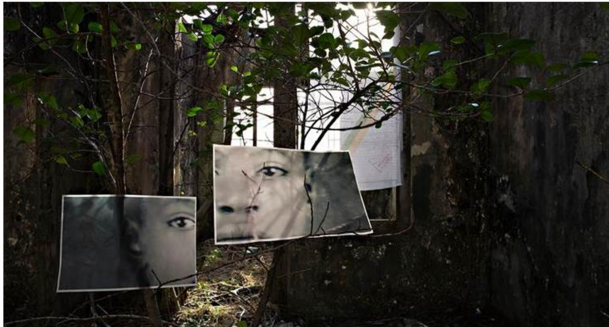
Trabalho do projeto Rumos 2015-2016