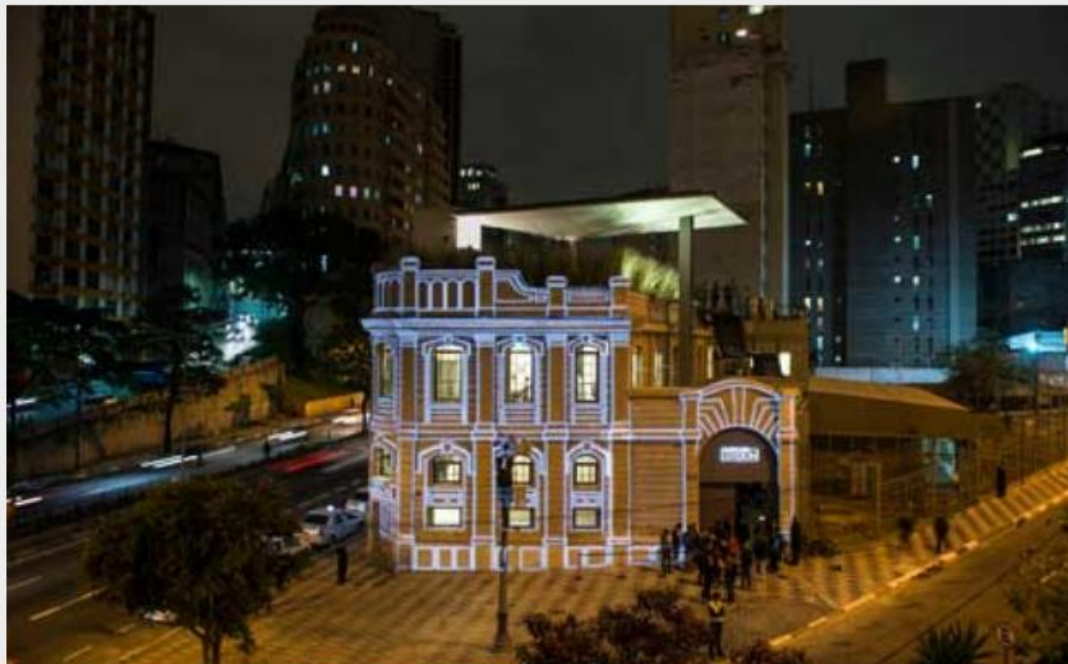
Video mapping ilumina a fachada na noite de abertura do Red Bull Station

Uma antiga subestação elétrica renasce como um novo ponto das artes.