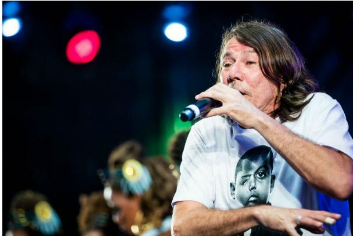
Lenine durante show com o Grupo Voz Nago