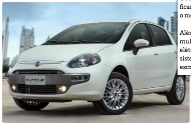
FIAT PUNTO SP

27/10/2014 11h28 - atualizado às 12h20 em 27/10/2014